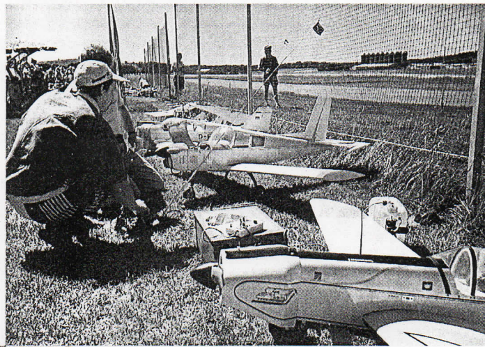
Die Bautzener Luftflotte