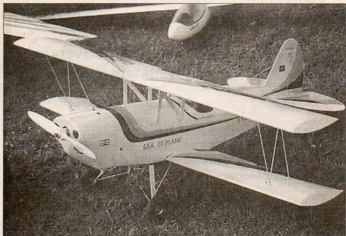
Bi Plane von den Leipziger Sportfreunden

Weitere Informationen zum Verein im Internet unter: www.msv-neustadt.de